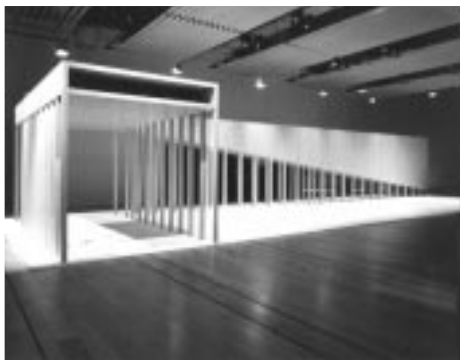
鈴木了二 物質的試行39 Biblioteca 1998 インスタレーション 396×1406×220cm

うすだ・しよじー 1943年生まれ、出版社勤務、タイポグラフィ、文字文化、装幀論を中心に執筆を行なう。編書『日本のブックデザイン1946-95』(ギンザ・グラフィック・ギャラリー)。