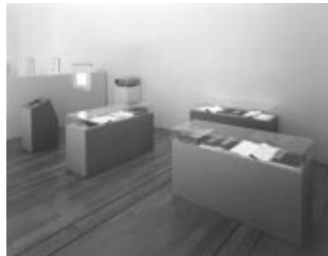
徐冰 天書 1991 木版刷書籍4冊、木箱 46×30cm(箱 49.2×33.7×9.5cm)