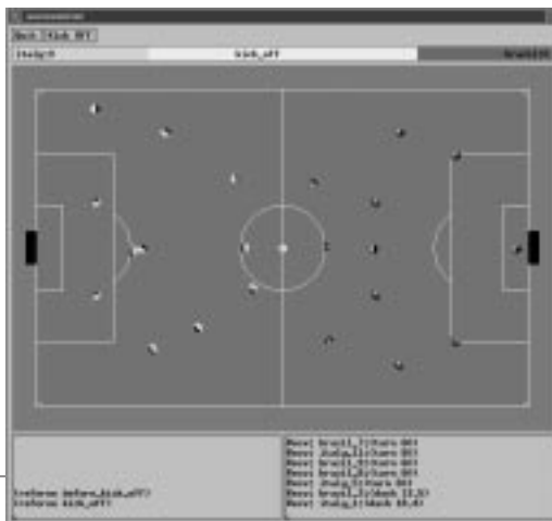
サッカー・サーバーの画面

組織的な立場から言うと、「ロボカップ」の試みは一般的なテーマとして面白いのですが、個人的な立場としては、ロボットの学習・進化や認知プロセスを含め、できれば認知モデルを発展させたいと考えており、そのベースとして「ロボカップ」を使いたい、というのが私自身の主旨でした。チェスが40年ものあいだ人工知能の標準問題になっていましたが、IBMのコンピュータ「ディープ・ブルー」が世界チャンピオンのガルリ・カスパロフを破って、一応の終結を見たのですから、新たに、チェスによる標準問題とは対照的な問題を設定すべきであろうということです。というのも、チェスは静的で、完全に情報が記述されており、一対一の闘いであるのに対して、「ロボカップ」のほうは複数のエージェントが協調しなければなりません。そして決定的に違うのは、多分、複数の意思決定エージェントが存在して何かをするという