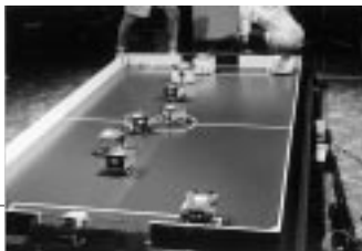
ロボカップ小型リーグのフィールド (1998年パリ大会)