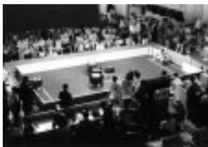
ロボカップ中型リーグのフィールド (1998年パリ大会)

残りの二つのリーグは実機のロボットによるもので、「小型リーグ」と「中型リーグ」に分かれていて、小型は直径15cmくらいのロボットなんですが、最初の頃はそこにセンサーやカメラ、CPUを搭載することに無理があったので、もちろん現在ではそれは可能ですが、最大5台の小さなロボットを、天井のカメラを使って全体のフィールドを見て制御するというものでした。つまり、1つのCPUで複数のボディが稼働するというタイプだったわけです。サッカーフィールドとしては卓球台を使い、サッカーボールとしてゴルフボールを使用しました。「中型リーグ」はだいたいロボットの直径が45cmくらいで、このサイズだとロボットにすべて搭載可能なため、天井カメラは禁止しました(第1回の名古屋大会では一部で許可したのですが)。そして純粋な分散制御、つまりロボットが自分自身のテレビカメラで見た映像だけを頼りに戦略を立てるもので、フィールドは卓球台の面積の9倍で、実際のサッカーフィールドの15分の1くらい大きさです。現状ではスローイングができないので周囲に壁を作っています。アイスホッケーみた